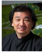
建築家 坂 茂

1957年東京生まれ。77-80年、南カリフォルニア建築大学(SCI-Arc)在学。84年クーパー・ユニオン建築学部(ニューヨーク)を卒業。82-83年、磯崎新アトリエに勤務。85年、坂茂建築設計を設立。 95年から国連難民高等弁務官事務所(UNHCR)コンサルタント、同時に災害支援活動団体ボランティア・アーキテクト・ネットワーク(VAN)設立。主な作品に、「ボンビドー・センター・メス」、「静岡県富士山世界遺産センター」、「大分県立美術館」、「ラ・セーヌ・ミュージカル」、「オメガ・スウォッチ本社」などがある。これまでに、フランス建築アカデミーゴールドメダル(2004)、日本建築学会賞作品部門(2009)、フランス国家功労勲章オフィシエ(2010)、オーギュスト・ペレ賞(2011)、芸術選奨文部科学大臣賞(2012)、フランス芸術文化勲章コマンドゥール(2014)、プリツカー建築賞(2014)、JIA日本建築大賞(2015)、紫綬褒章(2017)、マザー・テレサ社会正義賞(2017)、アストゥリアス皇太子賞(2022)など受賞。現在New European Bauhausのhigh-level roundtableメンバー、慶応義塾大学環境情報学部教授。