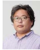
建築史・建築批評家 五十嵐太郎

1957年東京生まれ。77-80年、南カリフォルニア建築大学(SCI-Arc)在学。84年クーパー・ユニオン建築学部(ニューヨーク)を卒業。82-83年、磯崎新アトリエに勤務。85年、坂茂建築設計を設立。 95年から国連難民高等弁務官事務所(UNHCR)コンサルタント、同時に災害支援活動団体ボランティア・アーキテクト・ネットワーク(VAN)設立。主な作品に、「ボンビドー・センター・メス」、「静岡県富士山世界遺産センター」、「大分県立美術館」、「ラ・セーヌ・ミュージカル」、「オメガ・スウォッチ本社」などがある。これまでに、フランス建築アカデミーゴールドメダル(2004)、日本建築学会賞作品部門(2009)、フランス国家功労勲章オフィシエ(2010)、オーギュスト・ペレ賞(2011)、芸術選奨文部科学大臣賞(2012)、フランス芸術文化勲章コマンドゥール(2014)、プリツカー建築賞(2014)、JIA日本建築大賞(2015)、紫綬褒章(2017)、マザー・テレサ社会正義賞(2017)、アストゥリアス皇太子賞(2022)など受賞。現在New European Bauhausのhigh-level roundtableメンバー、慶応義塾大学環境情報学部教授。